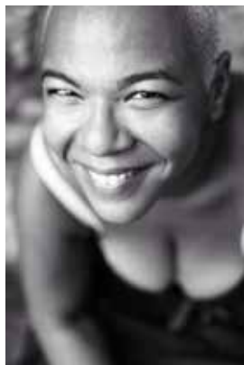
résidence à EroSphère 2014

Son domaine général pourrait se qualifier de « philosophie appliquée à la sexualité ». Plus largement, elle travaille à mieux comprendre et faire valoir la sexualité et les problématiques de genre dans la dimension politique et sociale.