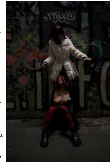
avec la doll Erena